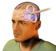
شکل ۱: حالت عمومی نحوه قرارگیری الکتروود و مبانی اعمال تحریک مغناطیسی مغز

ثابت شده که این روش بدون عوارض جانبی که بیماران در صورت مصرف دارو تجربه می کنند، است. تحریک مغناطیسی مغز یک روش تحریک الکتریکی مغز از طریق پوست سر بدون ایجاد درد ناشی از جریان مستقیم الکتریکی می باشد. یک تحریک کننده موجب تولید یک میدان الکتریکی با شدت مورد استفاده در آزمایش MRI در داخل سیم پیچی روی سر می شود که بسیار مختصر است. میدان الکتریکی تاثیری بر روی پوست و استخوان ندارد اما نورون های مغز با این تغییر کوتاه مدت در میدان مغناطیسی تحت تاثیر قرار می گیرند. این امر بطور موثری موجب القای یک جریان الکتریکی در آکسون های نورون های موجود در قشر مغز می شود. این نورون ها پیام را در جسم سلولی خود و نورون های مجاور انتقال می دهند (بوئینگ و سایرین، ۱۹۹۷؛ لوپز-ایبرو، لوپز-ایبرو و پاسترانا، ۲۰۰۸؛ میلز، ۲۰۱۷).